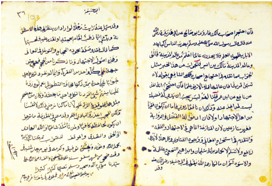
صورة اللوحيتين الأولى والأخيرة من نسخة مكتبة ديار بكر،